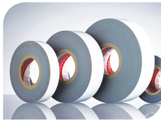
Kesim İşlemi Yapılmış Koruyucu Bantlar Cutting Protective Bands