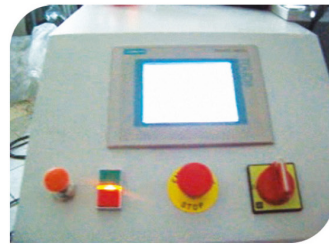
Geniş Programlama Kapasitesi Sayesinde Kesim İşlemini Kolaylaştıran PLC Dokunmatik Ekran PLC Sensor Monitor for Ease Cutting Process according Large Programming Capacity